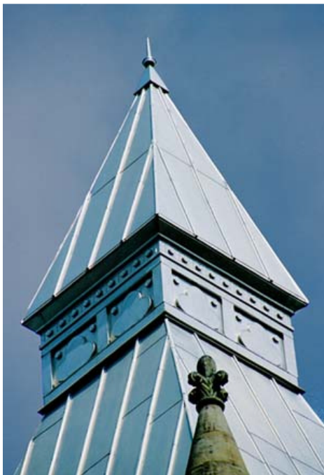
Figura 3: Telhado em aço inoxidável 302 do 'Butler County Court House' com cerca de 80 anos sem problemas e manutenção.

Materiais que continuam a oferecer um excelente desempenho ao longo da vida útil da construção ou estrutura apresentam um custo muito mais baixo do ciclo de vida e não causam impacto ao meio ambiente porque não exigem substituição nem contribuem para o aumento dos resíduos nos aterros sanitários. O aço inoxidável é um material arquitetônico relativamente novo, tendo suas aplicações mais antigas realizadas em meados dos anos 20, não muito depois da invenção do aço inoxidável. Um exemplo de uma cobertura em aço inoxidável mais antiga é o da sede do tribunal 'Butler County Court House' na Pensilvânia, que se manteve intacto e atraente por cerca de 50 anos apesar de estar ao lado de uma planta industrial (veja figura 3).