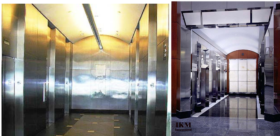
Figuras 8 e 9

Este não é o único exemplo de reutilização do aço inoxidável. Painéis de parede externos em aço inoxidável foram recentemente limpos, reformatados e reutilizados quando um edifício comercial em Nova York foi esvaziado e reformado. A durabilidade do aço inoxidável significa que ele pode manter-se em uso enquanto outros produtos de construção seguem para os aterros sanitários.