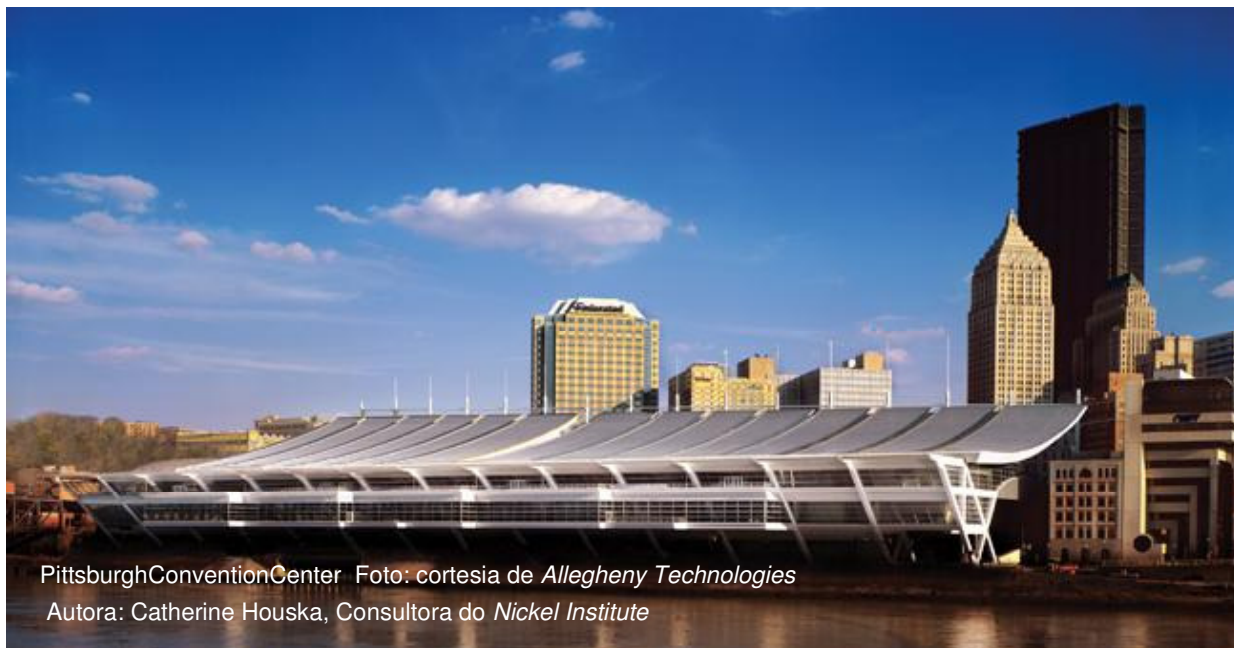
Pittsburgh Convention Center Autora: Catherine Houska, Consultora do Nickel Institute