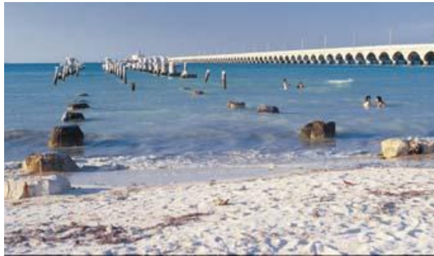
Figura 4: O pier Progresso, no México, foi construído com vergalhões de aço inoxidável entre 1939 e 1941, e ainda está em perfeitas condições. O pier inutilizado foi construído com vergalhão de aço carbono em 1969.

substituição e interrupção de uso, todos os materiais originais precisam ser substituídos a um custo ambiental considerável.